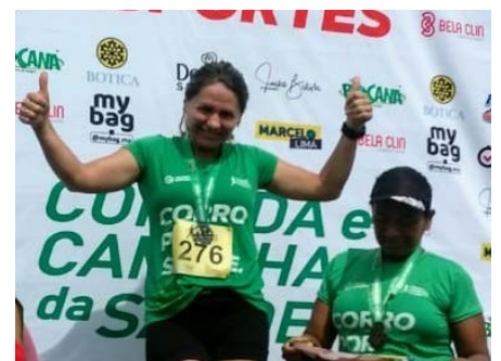
Destaque na Corrida da Saúde