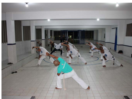
Reinauguração Salão D'Angola