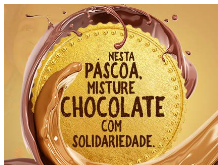
Campanha de Páscoa 2019