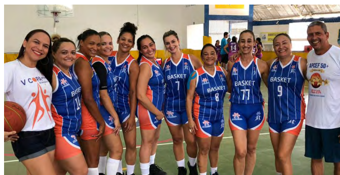
Dois times de Basquete da Apcef/MA estão nas finais da Copa AAB