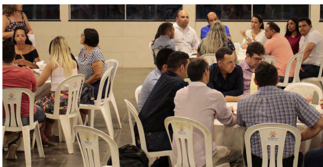
A Apcef/MA recebeu, para um jantar, novos empregados da Caixa