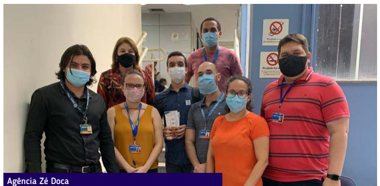
Agência Zé Doca