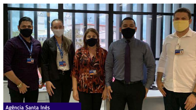
Agência Santa Inês