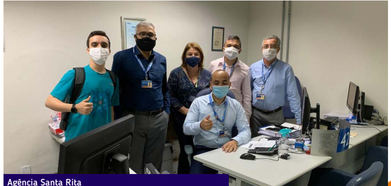
Agência Santa Rita