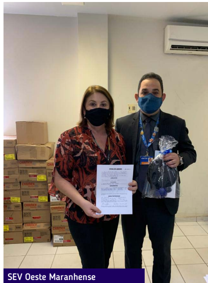
SEV Oeste Maranhense